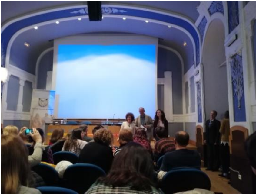
Entrega de los premios de Asturias a algunos de lxs ganadorxs.