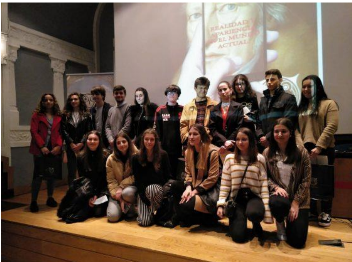
Foto del grupo de participantes en el acto del Antiguo Instituto de Gijón.