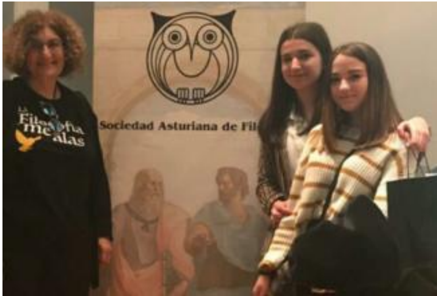
Alumnas ganadoras del IES El Suevo acompañadas por su profesora.