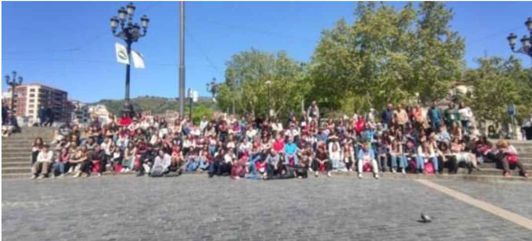
En Bilbao, con las participantes de la IX OFE.